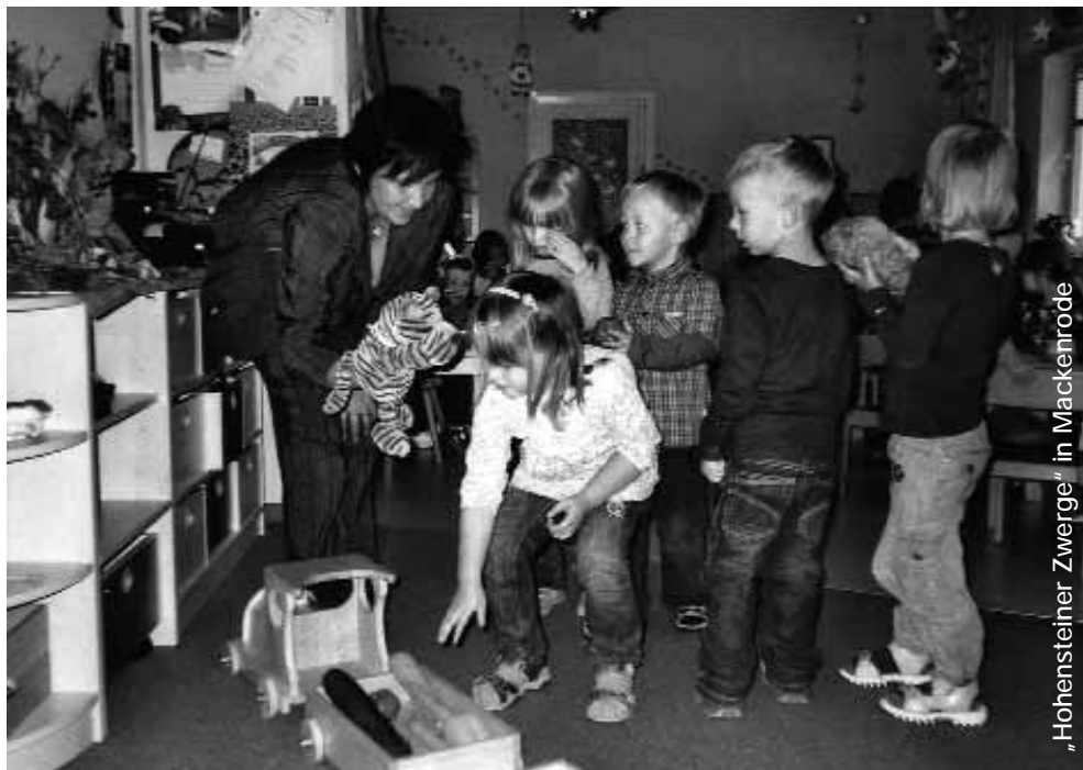
„Hohensteiner Zwerge“ in Mackenrode