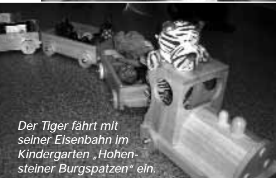
Der Tiger fährt mit seiner Eisenbahn im Kindergarten „Hohensteiner Burgspatzen“ ein.

steiner Burgspatzen“ in Klettenberg und „Hohensteiner Zwerge“ in Mackenrode die Aktion der AOK PLUS Thüringen.