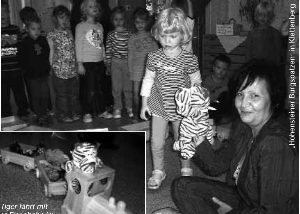
„Hohensteiner Burgspatzen“ in Klettenberg