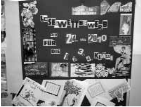
Die besten Leser unserer Grundschule sind:

Neues aus der Grundschule „Thomas Münzer“ Klettenberg