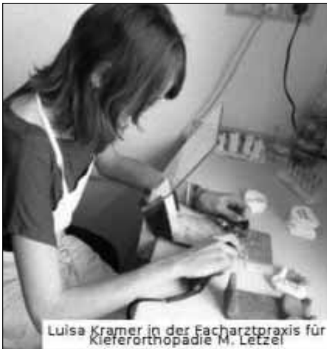
Die Schülerinnen und Schüler der Klassen 9a und 9b erkunden in ihrem Betriebspraktikum die Be-

rufswelt. Die meisten haben sich ihre Praktikumsstellen selbst in den verschiedensten Unternehmen der Region ausgesucht. Dabei mussten sie schon einmal mit den einzelnen Unternehmen Kontakt aufnehmen und haben so erste Erfahrungen sammeln können, wie man sich in einem Unternehmen vorstellen muss.