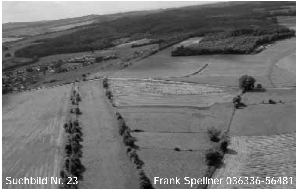
Suchbild Nr. 23