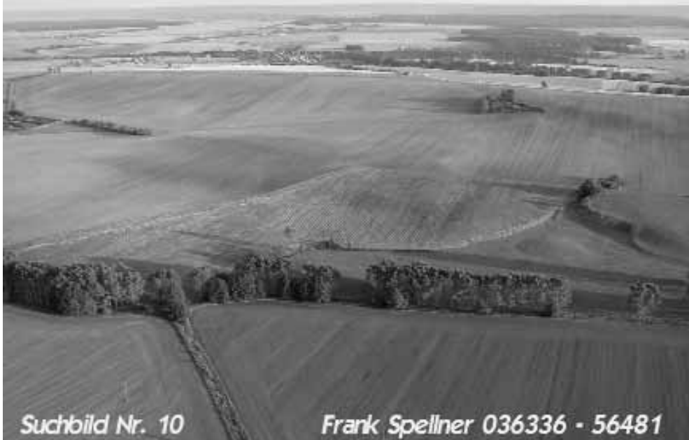
Suchbild Nr. 10