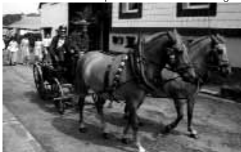
Die Feuerwehr zur Gründung 1880