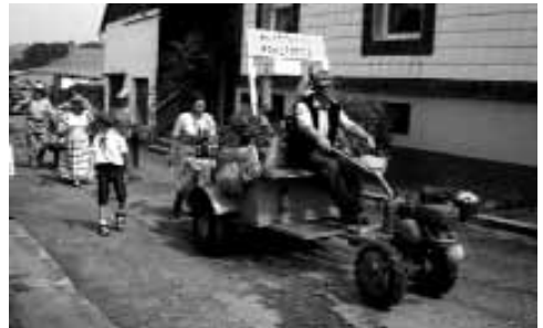
Bis 1990 wurden im Dorf Altstoffe angenommen