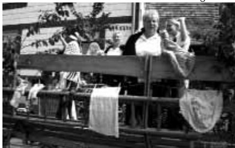
Früher trafen sich die Frauen in der Spinnstube