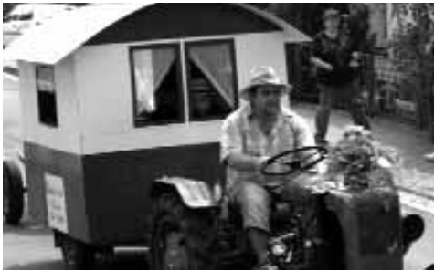
auch Schausteller gab es im Dorf