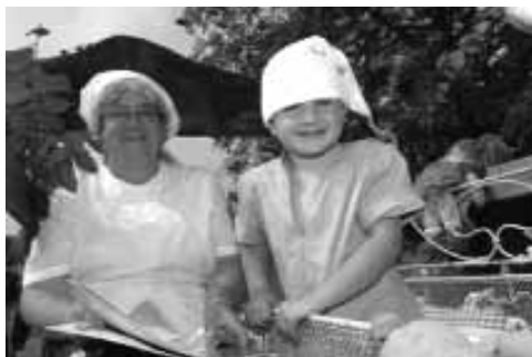
Oma beim Vorlesen