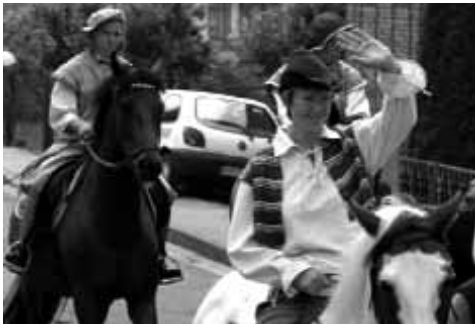
Gut gelaunt, die Reiter