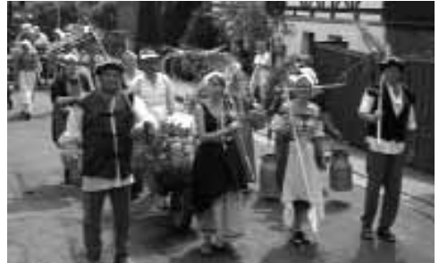
Landwirtschaft im Wandel der Zeiten