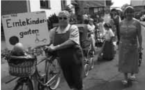
Bis 1968 gab es den Erntekindergarten