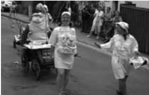
Früher die Zahnreißer, heute der Zahnarzt