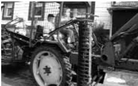
Alter Traktor mit Binder