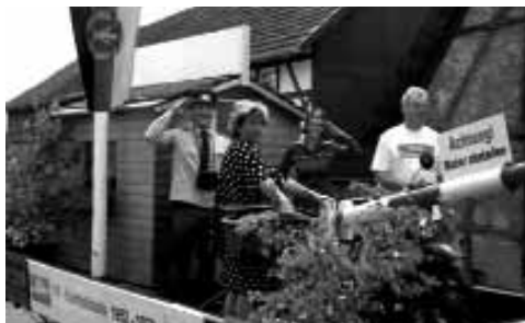
Bis 1973 stand vor dem Dorf der Schlagbaum