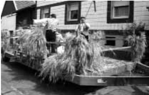
Dreschen mit dem Dreschflegel