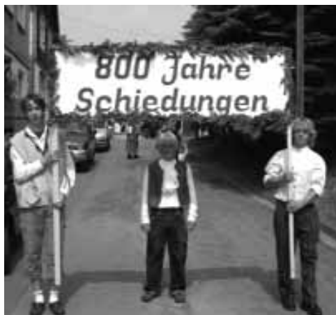
Die drei jungen Männer mit dem festlich geschmücktem Jahresschild.

Der Ausrufer legte sich wie vor 50 Jahren mächtig ins Zeug, zur Freude des Dorfschulzen.