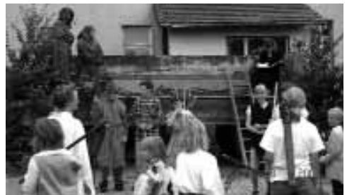
Die Dorfjugend spielte das „Gericht am Schiedunger Teich“ nach