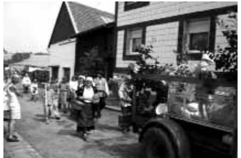
Großfamilie mit allem Hausrat