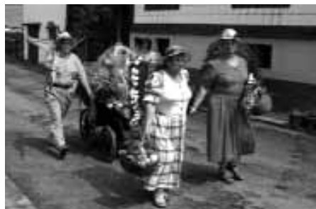
Von links: Die Jäger, das Lehrerehepaar und der geschmückte Erntewagen zur Kirmes.