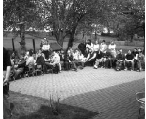
Freudig lauschten die Eltern ihren Kleinen

Einer der Höhepunkte für Groß und Klein in der Kindertagesstätte Mackenrode ist der jährlich stattfindende Mama-Papa-Tag. Die mit großer Spannung von den Kindern erwartete Feier war am 13. Mai diesen Jahres. Das liebevoll einstudierte Programm der Knirpse fand großen Anklang bei den Eltern. Mit leckerem selbstgeba-