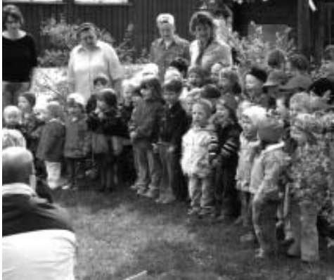
Stolz zeigten die Kinder ihr einstudiertes kleines Programm