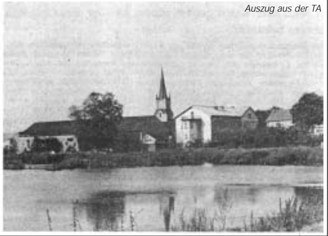
Auszug aus der TA

Schon vor über 400 Jahren befand sich bei Schiedungen ein etwa 100 Morgen großer Teich, der von einem Damm umgeben war. Hier trafen sich die Klettenberger und die Lohraer Bauern, wenn sie Fronfahren zur Herbeischaffung von Baumaterial leisten mußten. 1523, nach der Niederlage bei Frankenhäusern, hatten sich die Bauern der Grafschaft Hohnstein – Lohra – Klettenberg hier dem Grafen Ernst V. und seinen Ritters zu unterwerfen, in weißen Kitteln zu erscheinen und in der Hand abgeschälte Weidenstöcke zu tragen. Dafür, daß sie Münzers Ruf gefolgt wären, wurden sie mit hohen Geldbußen bestraft. Der Teich ist heute ein Paradies für Wasservögel und ein lohnendes Ausflugsziel.